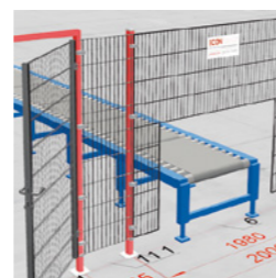
Gitter Zu- und Ausschnitte