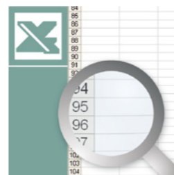
Stücklistenexport zu MS Excel®